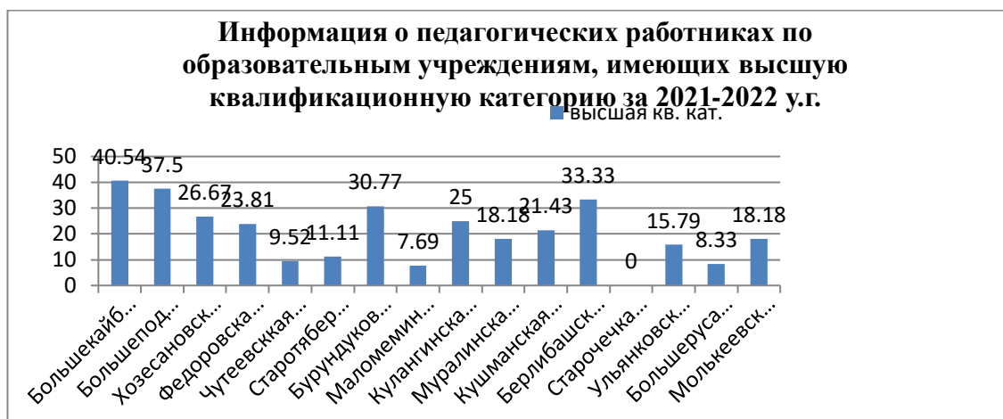
Рис. 2 Показатели высшей квалификационной категории в разрезе школ