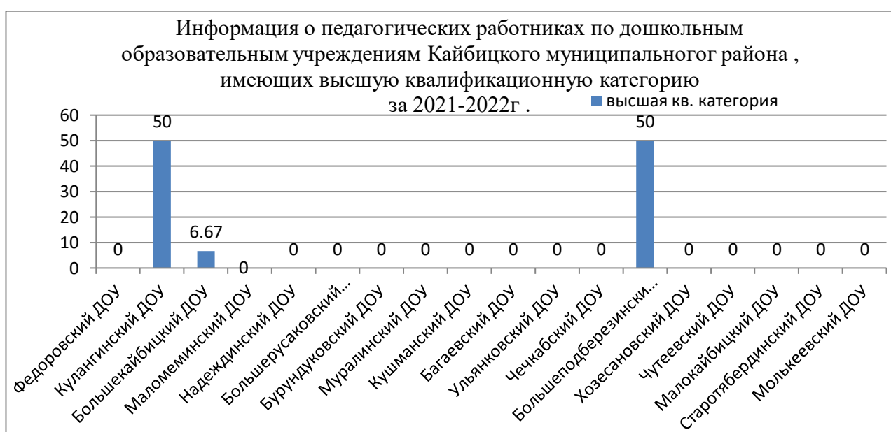
Рис.3 Показатели высшей квалификационной категории в разрезе ДОУ